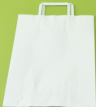
あつ で かみ ぶくろ 厚手の紙袋