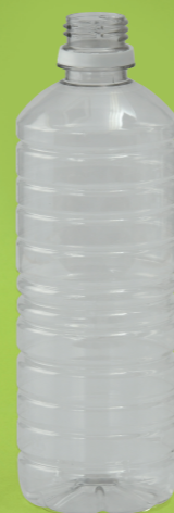
しよつ き ペットボトル

よう あら と リサイクル用に洗って取っておいた牛乳パックを箱の形にき切ってホチキスでとめ、アルミ箔などをかぶせます。