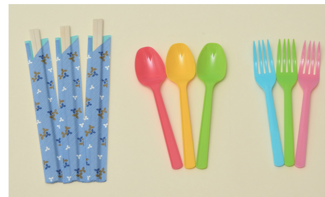
はしなども用意しよう

あつ で かみぶくろ ぎゅうにゅう 厚手の紙袋や、牛乳パック、 ペットボトルを使って、食器を つくることができます。