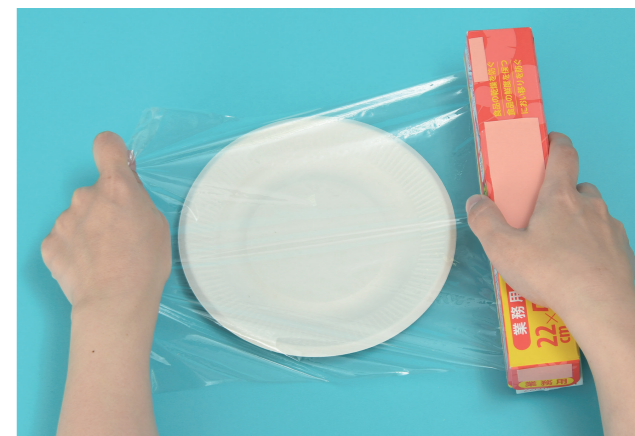
しよつ き よご つか くふう 食器を汚さずに使う工夫

ペットボトルを切って、ポリ袋などをかぶせます。 ※温かいものは、ホット用のペットボトルを使いましょう。